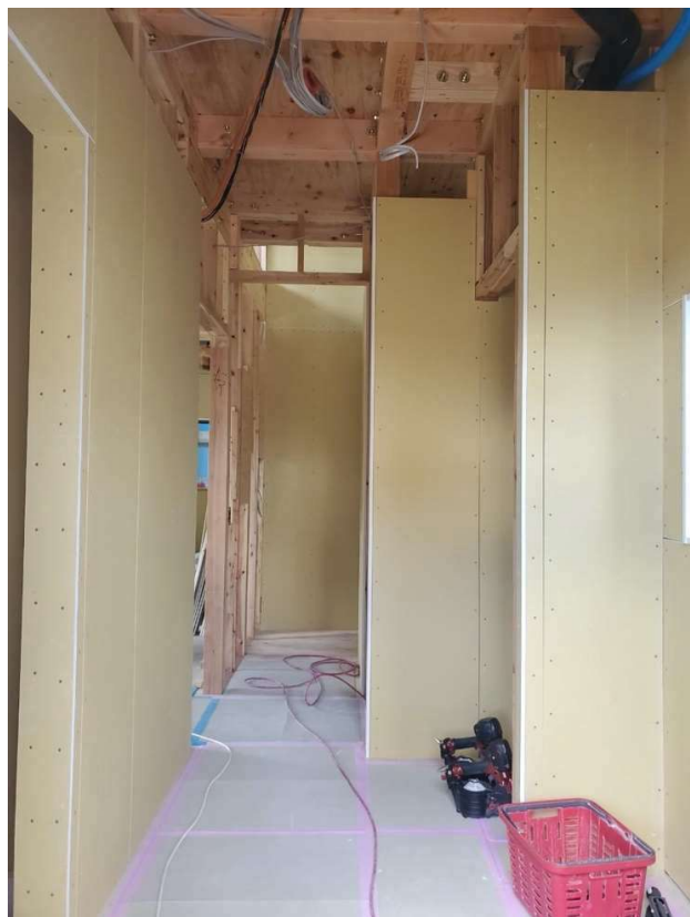
△玄関正面には階段で二階へと続きます