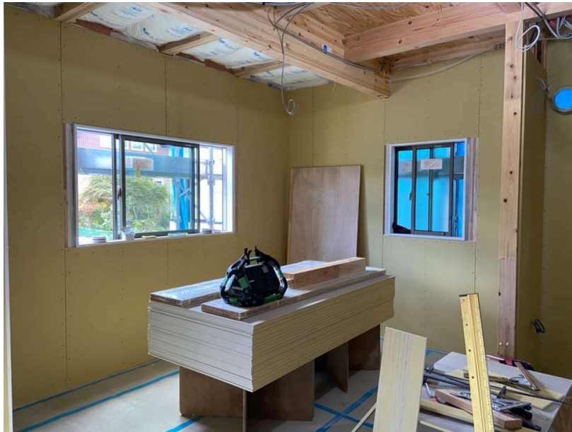
△家族が自然と集まるようなリビングダイニングへ。