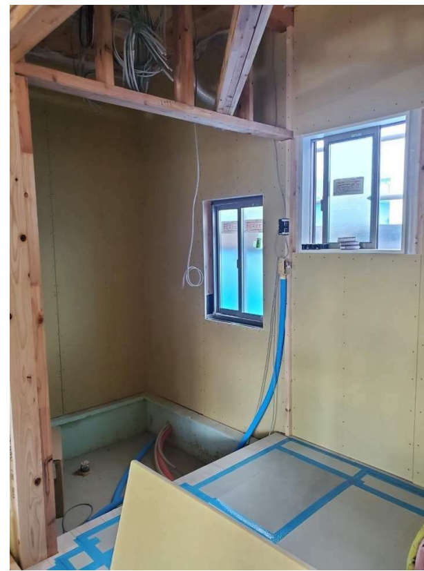
△洗面脱衣室は着替えもストレスなくできる広さです