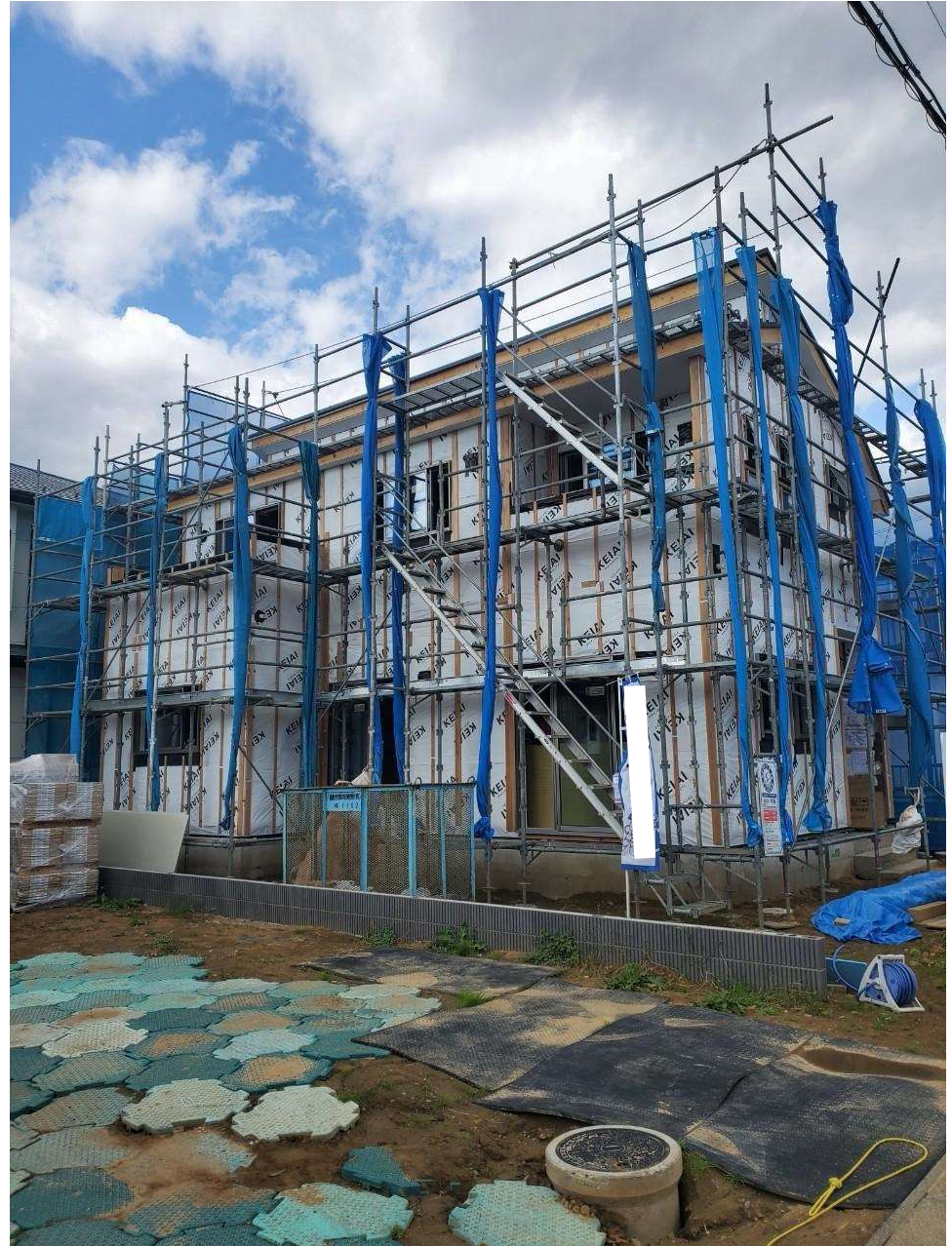
△ 10月上旬撮影 完成に向けて工事が進んでおります。11月完成予定