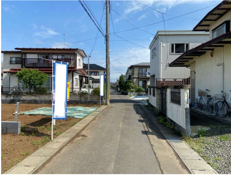
△ 車通りが少ないのでお子様も通学も安心です