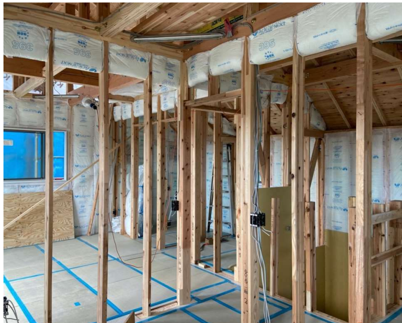
△2階は各部屋収納とウォークインクローゼットがあります フリースペースもあり、すっきりとした住まいの実現可能です