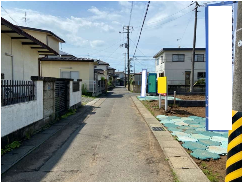
△ 最寄りのバス停、郵便局はこちらの道路が最短ルートです