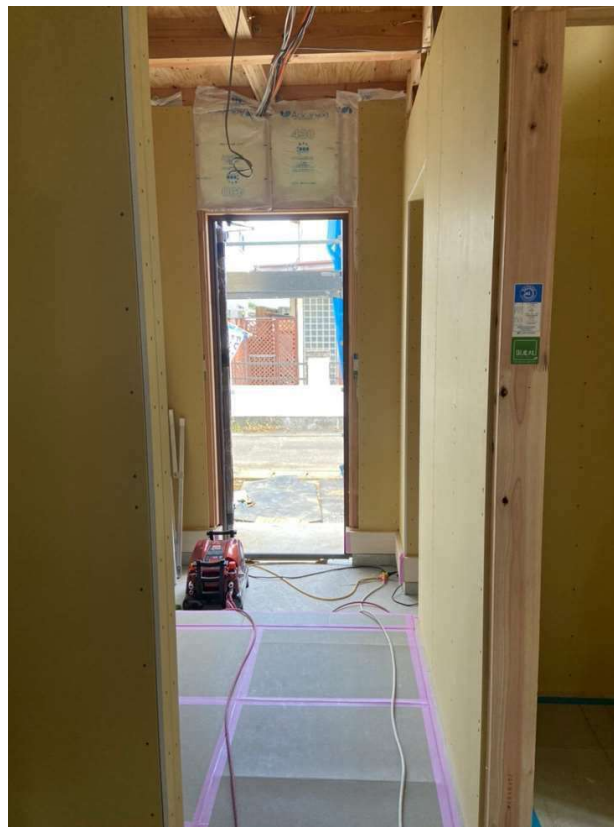
△玄関ホール部分にも収納が完備されています